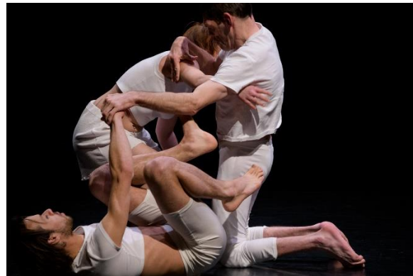
Parade